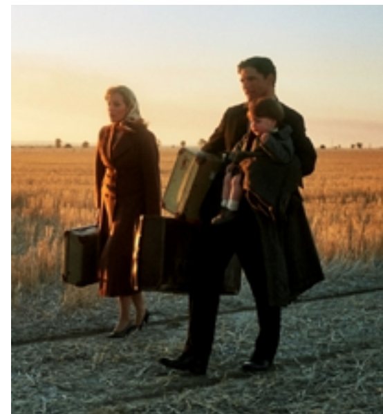
Scena del film Romulus, My Father .

Considerata la presenza nel cast di Eric Bana e del giovane Kodi Smit-McPhee , questo è il film da non perdere del festival!