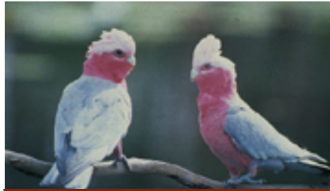
Un "Galah" è un uccello comune in Australia ed è anche una forma slang per definire una persona sciocca (vedi la sezione "Scusa ripeti?" qui di seguito).