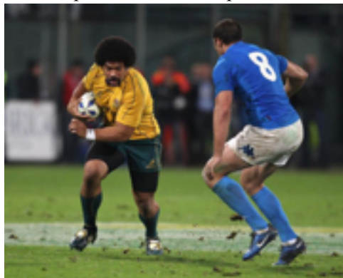
I Wallabies contro gli Azzurri a Firenze.

Rugby – Italia e Australia quest'anno fanno parte dello stesso gruppo per la Coppa del Mondo di Rugby , che si terrà in Nuova Zelanda e le due squadre si incontreranno a Christchurch l'11 settembre. Un assaggio di cosa possiamo aspettarci l'abbiamo avuto allo Stadio Franchi di Firenze a novembre, quando durante il tour europeo i Wallabies hanno battuto gli Azzurri 32 a 14. Ci piacerebbe pensare che le possibilità dell'Italia nella Coppa del Mondo siano aumentate, avendo scelto alcuni giocatori italo-australiani come Luke McLean , Craig Gower e Kristopher Burton per le loro recenti partite.